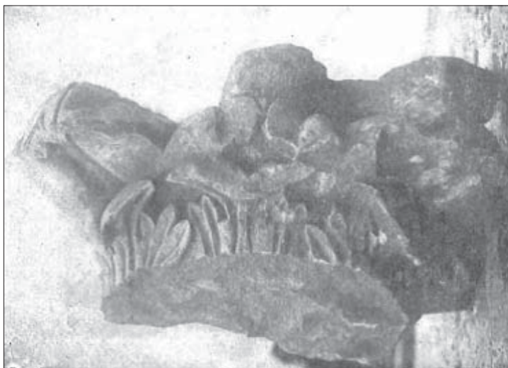
(Prema: Sergejevski, 1948, Tbl. VI, sl. 3)

česta praksa na ovim prostorima od strane lokalnih stanovnika. Međutim, teško je vjerovati da se izvorni objekat nalazio na nekoj većoj udaljenosti od mjesta pronalaska dijela kapitela, pa bi zbog toga potencijalnu crkvu najbolje bilo tražiti u njegovoj neposrednoj blizini.