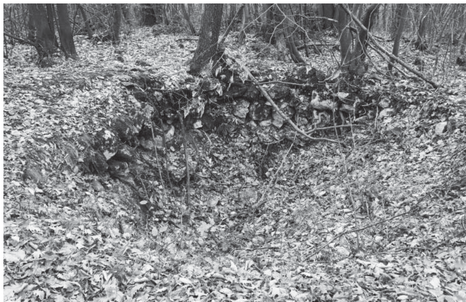
Sl. 1. Ostaci zidova na brdu Kostur (autor: G. Popović)

Naselje Ugljari danas je poznato po Rudniku kvarca “Bijela stijena”. Međutim, za sada ne znamo da li je kvarc ovde eksploatisan i u antici. U Sirmiumu su pronađene staklarske peći, ali nije poznato odakle je poticao kvarc koji je korišćen za izradu stakla. 62