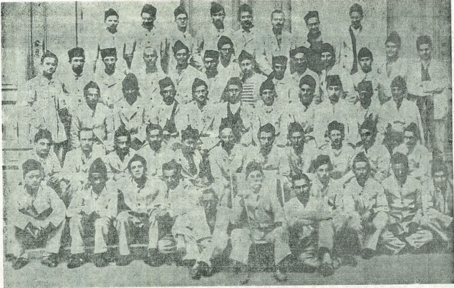
GRUPA KOMUNISTA ROBIJAŠA U LEPOGLAVI 1935—1936. (MRBiH Sarajevo, inv. br. FRP 1067) I red odozdo s lijeva na desno: 1. Andrija Hebrang (Fati), 2. Momi Levi (Sunja), 3. Milovan Đilas (Đido), 4. Milorad Petrović (Suca), 5. Moša Pijade (Mladen — Siki), 6. Josip Čački, 7. Milan Mijalković (Stojilko), 8. Neidentifikovan, 9. Neidentifikovan, 10. Bane Andrejev (Backo), 11. Neidentifikovan. II red: 1. Stanko Paunović (Pulimjot), 2. Jajčić (ing. (?)), 3. Neidentifikovan, 4. Neidentifikovan, 5. Neidentifikovan, 6. Đuro Pucar, 7. Branko Fridman, 8. Rudolf (?), Rajnpreht, 9. Martin Simić, 10. Josip Salaj, 11. Radivoje Davidović (Kepo). III red: 1. Oskar Davičo (Moška), 2. Zanko Zrenjanin (Učo), 3. Neidentifikovan, 4. Ivan Milutinović (Cvorak), 5. Neidentifikovan, 6. Jovan Bejanski (Lala), 7. Neidentifikovan, 8. Miha Aleksić, 9. Neidentifikovan, 10. Petko Miletić (?). IV red: 1. Stevo Boljević, 2. Boris Vojmilović (Torej), 3. Majer Samuel, 4. Drago Krndija, 5. Neidentifikovan, 6. Jovica Trajković, 7. Neidentifikovan, 8. Neidentifikovan, 9. Moma Đorđević, 10. Neidentifikovan, 11. Branko Solarić, 12. Neidentifikovan, 13. Ognjen Prica, 14. Mujkić (?). V red: 1. Branko Bujčić (Sedmak), 2. Đuro Špoljanić, 3. Nikola Grubor, 4. Neidentifikovan, 5. Neidentifikovan, 6. Ivan Marković (Irac), 7. Otokar Keršovani (Čira — Enciklopedija, 8. Neidentifikovan. (Identitet utvrdio autor članka).