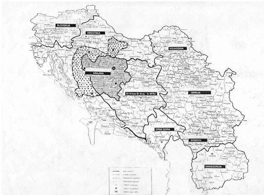
Karta 2: Teritorij 'Krajine' u sastavu 'nove' Jugoslavije.