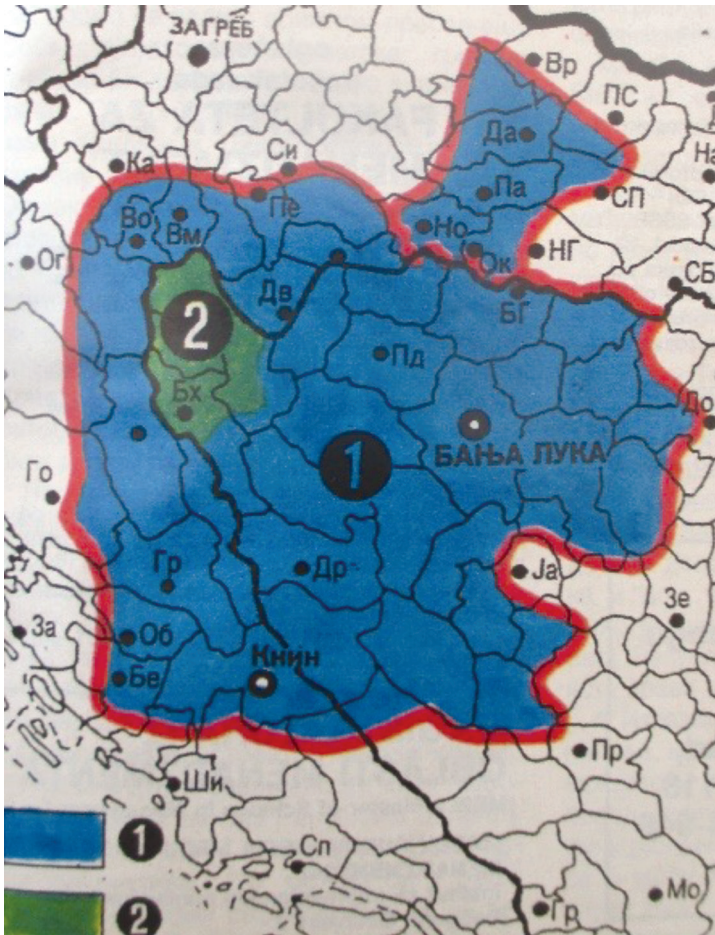
Karta 1: Srpska krajina, Zapadne srpske oblasti, Izvor: Epoha , 22. oktobar 1991, str. 17.

Oslanjajući se na Cvijićeva istraživanja Balkanskog poluotoka, a kao najbolje rješenje “problematike razgraničenja u Bosni i Hercegovini”, Jovan Ilić je predlagao da “ova Republika ostane u Trećoj Jugoslaviji”, ali i da se teritorije s većinski hrvatskim stanovništvom pripoje Republici Hrvatskoj te da “ostatak BiH” bude politički i pravno “organizovan po ustavu Treće Jugoslavije i po ustavu (nove) BiH”. 74