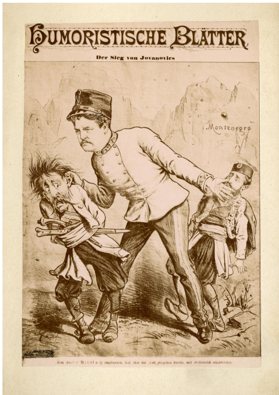
Prilog 4. Karikatura o Jovanovićevoj akciji u Hercegovini iz novina Humoristički listovi s naslovom "Jovanovićevo pobjeda" 82