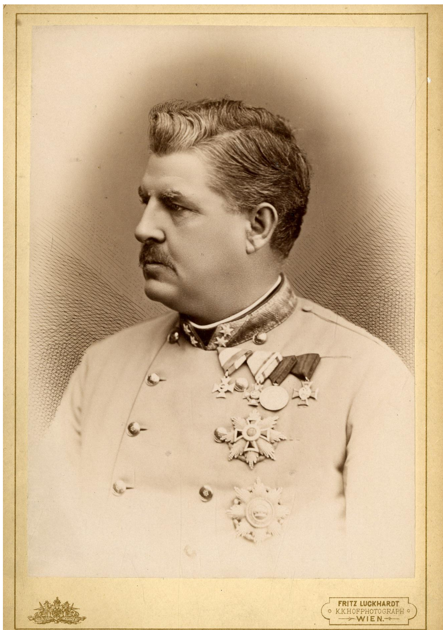
Prilog 2. Portret barona Stjepana Jovanovića. 80